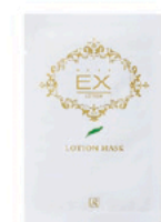
★ロイヤルハーブ EXローション マスク 18mL/1枚 3枚入 1箱 4,500円 (税込4,950円) *角質層まで